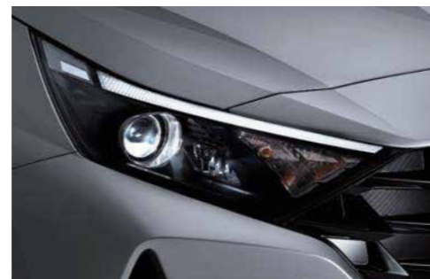
Faros delanteros LED