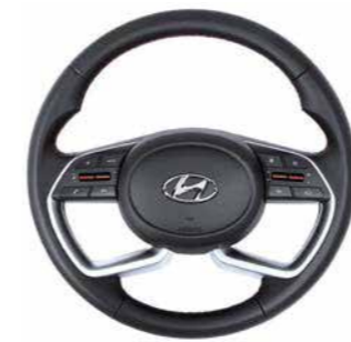
Volante deportivo de 4 rayos

El interior del nuevo i20 presenta toques de diseño muy distintivos y mucho espacio adicional, los asientos traseros son los más amplios en su clase. El centro de atención es el grupo de supervisión, que mide 12.3 pulgadas, mientras que la pantalla de audio de 8 pulgadas ofrece funciones de conectividad de vanguardia y funciona con la facilidad de una tableta pc.