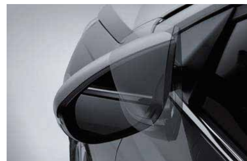
Espejos eléctricos plegables