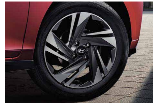
Llantas de aleación en dos tonos de 16"