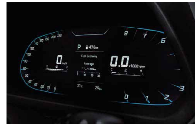
Tablero de supervisión