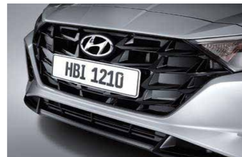
Parrilla Negro Fantasma