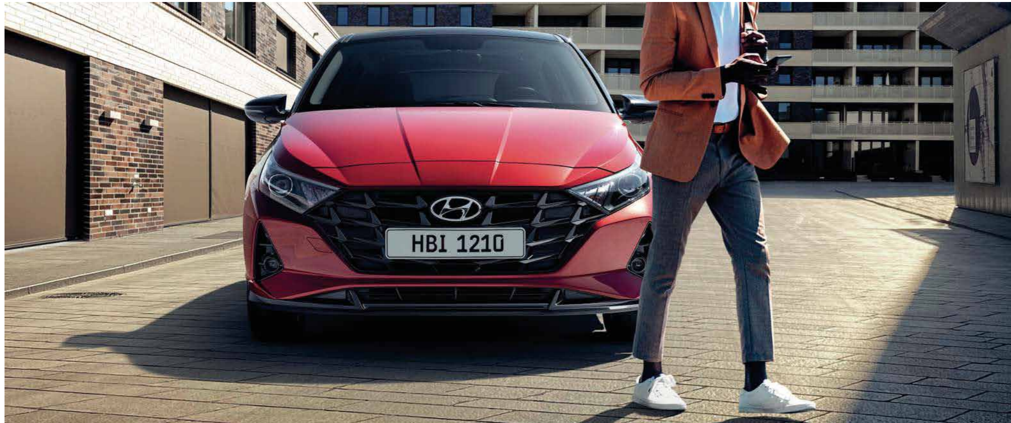
Frente y centro: estilo deportivo

El liderazgo de estilo de Hyundai se muestra en su totalidad en el nuevo i20 deportivo y amante de la diversión. Más ancho, más largo y equipado con iluminación LED, un esquema de color exterior de dos tonos y una parrilla de estilo paramétrico audaz, el nuevo i20 irradia el novedoso lenguaje de diseño de Deportividad sensual de Hyundai en absolutamente cada detalle.