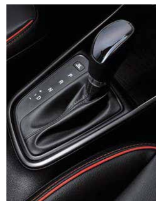
DCT de 7 velocidades