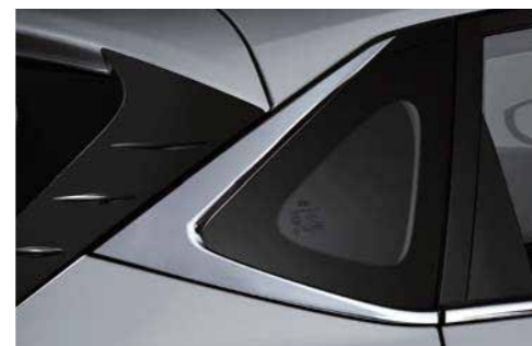
Molduras de borde cromadas