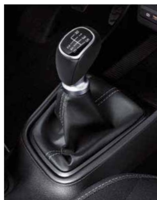
MT de 6 velocidades