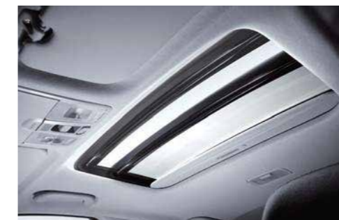
Techo corredizo eléctrico