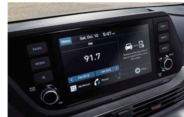
Pantalla de audio V2.0 de 8"