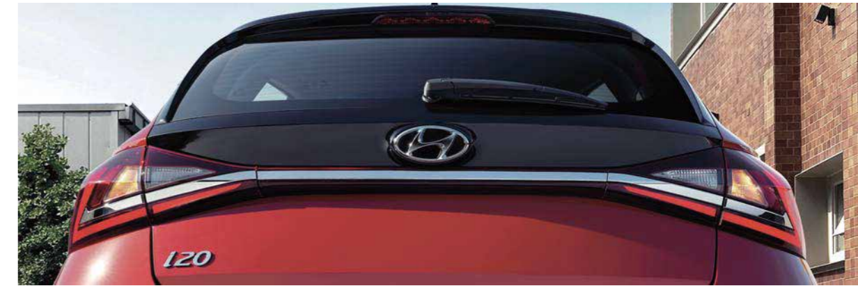
Aspecto trasero verdaderamente único Lámpara combinada LED en forma de Z