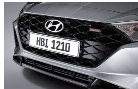
Parrilla Negro Fantasma (Turbo)