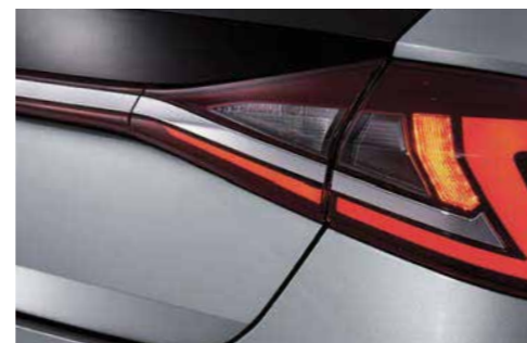
Adorno trasero cromado