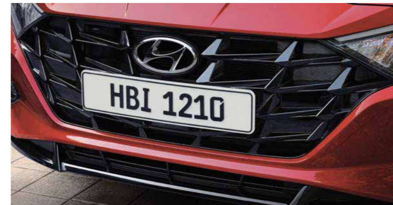
Faros delanteros LED Parrilla Negro Fantasma