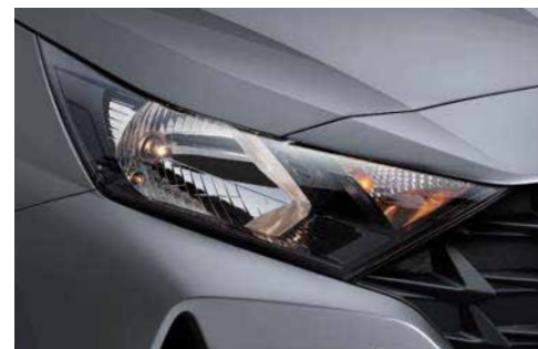
Lámparas halógenas (2MFR)