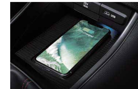
Sistema de carga inalámbrico para teléfonos inteligentes