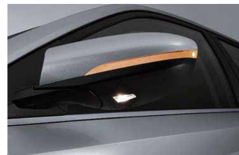
Luz para charcos