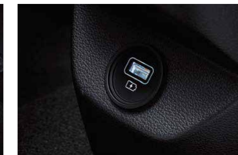
Puerto de carga USB trasero

* Las características y especificaciones varían según el mercado. Consulte al distribuidor local.