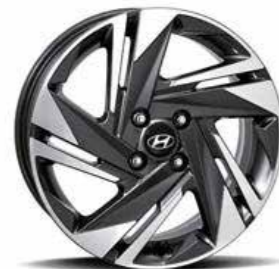
Llantas de aleación en dos tonos de 16"