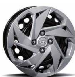
Llanta de acero de 15" con cubierta de tamaño completo