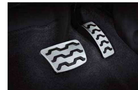
Pedales de aluminio